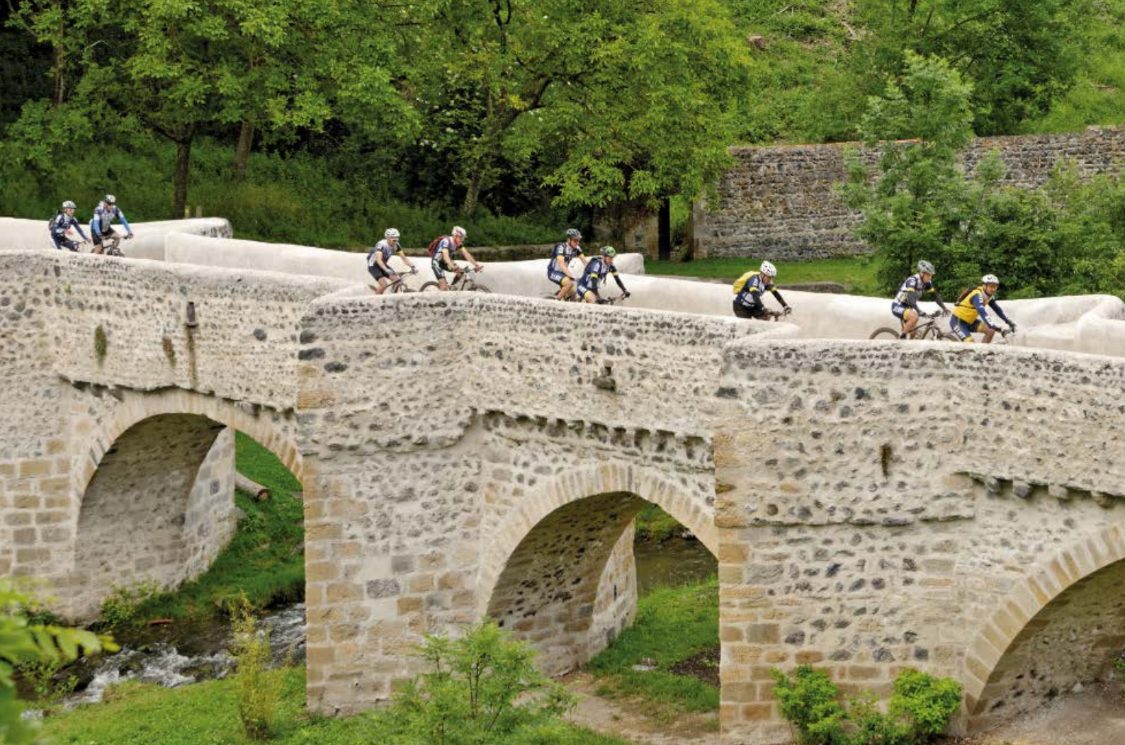
Vététistes sur le pont de Saint-Amant-Tallende lors de l'édition 2016 de « La Gergovienne »